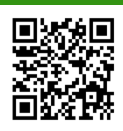
Кафедра "География" ВКонтакте

Группа Молодежного Клуба РГО: vk.com/mk_rgo_penza