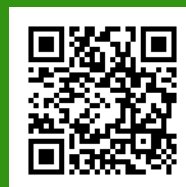
Официальный сайт кафедры